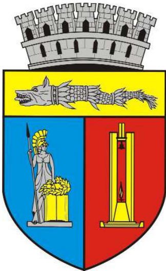
Primăria și Consiliul Local Cluj-Napoca