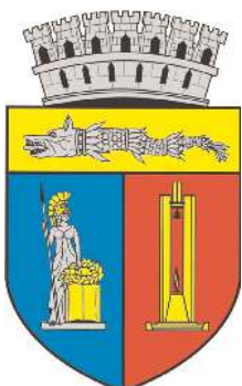
Primăria și Consiliul Local Cluj-Napoca