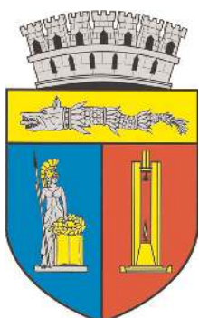
Primăria și Consiliul Local Cluj-Napoca