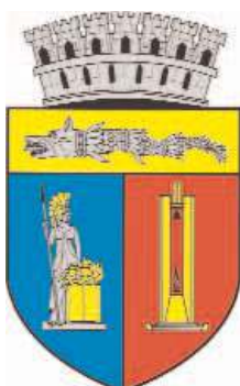
Primăria și Consiliul Local Cluj-Napoca